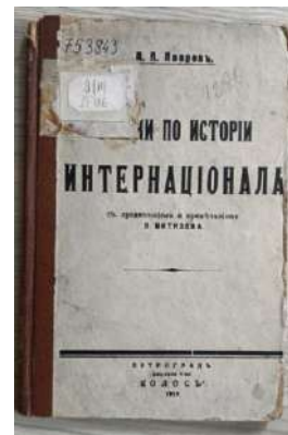
Книга «Очерки по истории Интернационала» НСМЗДЗ КМ КП № 6109 ГК 52034202