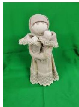
Кукла-кружевница НСМЗДЗ КП 4351/6 ГК 51346076