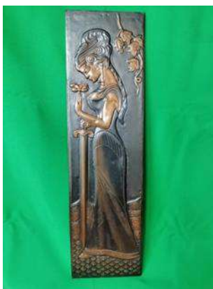
Панно-чеканка «Царица Тамара» НСМЗДЗ КП № 4392/15 ГК 54613876

В коллекцию «Редкой книги» поступил альбом с репродукциями «Из жизни Христа. В. Поленова» 1909 г. Альбом посвящен выставке цикла работ «Из жизни Христа» художника Василия Дмитриевича Поленова, открытой в Москве в 1909 году. Поленов называл этот цикл «главным трудом своей жизни». Работа продолжалась с 1899 по 1909 годы, и за это время художником было создано более 60 полотен евангельской тематики. В коленкоровом переплёте с тиснением.