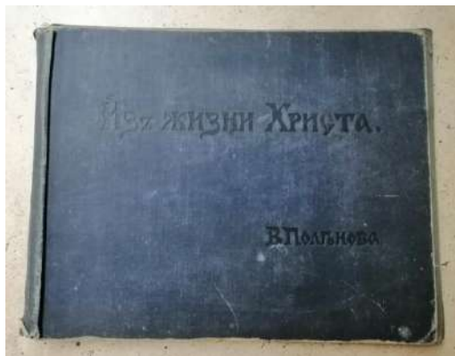
Альбом с репродукциями «Их жизни Христа. В. Поленов» НСМЗДЗ КП № 4359 ГК 51323536